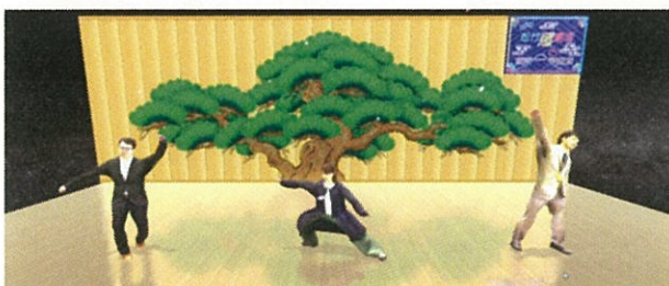
※現在、開発中の画面です。